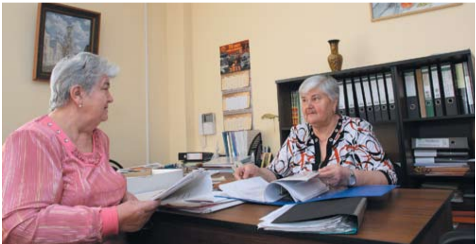
За годы работы в Совете ветеранов сложилась система, позволяющая быстро и эффективно решать большое количество дел