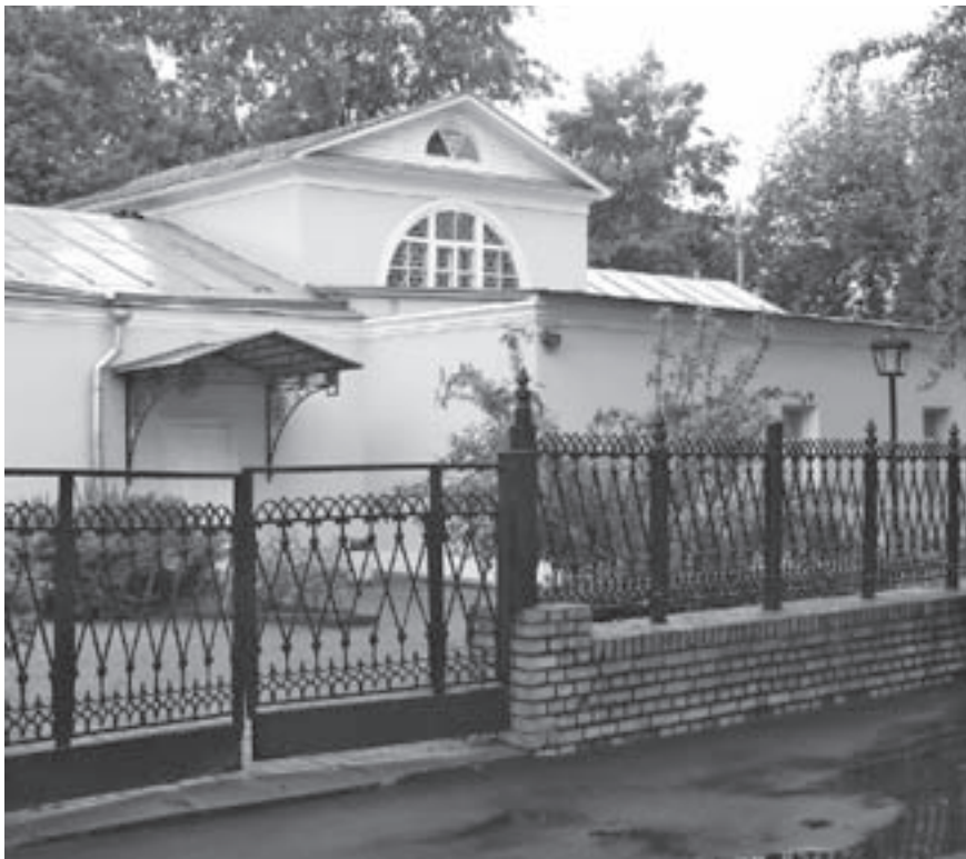
Культурно-образовательный центр «Школа Л. Н. Толстого» в доме на Пятницкой, 12

Неслучайно в начале статьи приведено свидетельство Афанасия Фета: в этот период московской жизни Толстого они общаются часто и доверительно. На Пятницкую к Толстому приходит и Салтыков-Щедрин. Одним из сблизивших их обстоятельств стала общая страсть к цыганскому пению, которым они наслаждались в гостинице «Шевалье» в Камергерском пе-