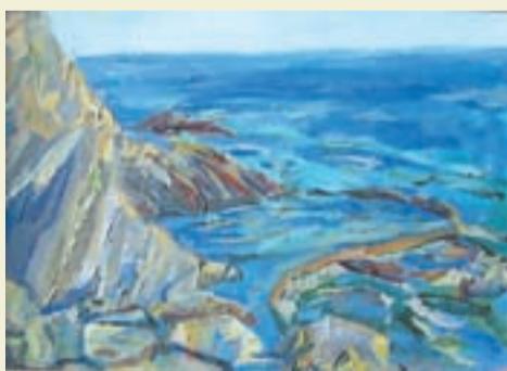
Осень. Море. 2007 г.

— В 2000 году была моя выставка в столице Иордании Аммане в королевском культурном центре под патронажем принца Хасана. В Палестине я открыла для себя мир Ближнего Востока. Писа-