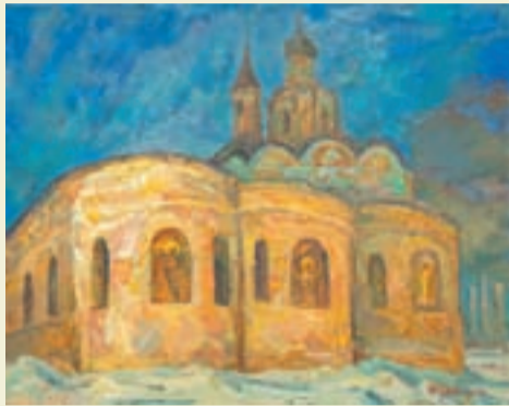
Собор на Плющихе. 2009 г.

— Окончив институт, вы попали по распределению в Комбинат живописного искусства на Тверской улице. Какие интересные события происходили в этот период?