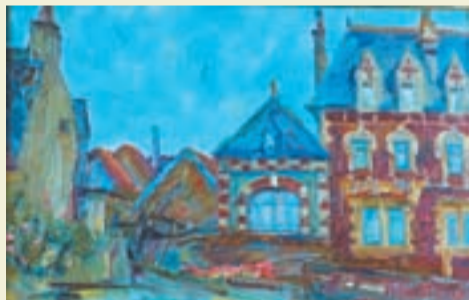
Набережная. Порт Байль. 2010 г.

После революции жильцы дома — выходцы из дворянских семей, жили под страхом ареста. Мыслили по-немецки, ругались по-французски, писали по-русски, читали по-английски, и скрывали свое образова-