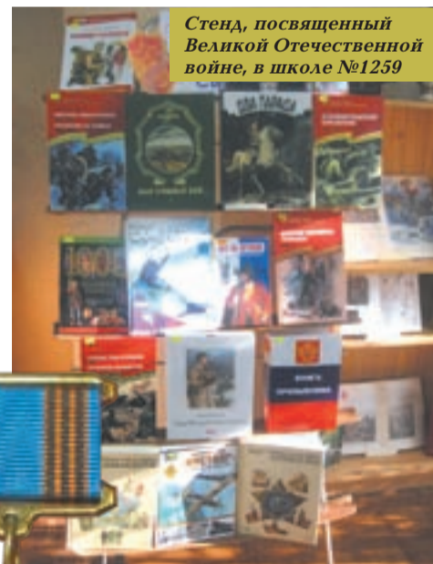
Стенд, посвященный Великой Отечественной войне, в школе №1259

Школьники с удовольствием слушали рассказ настоящего бойца, который и после страшной войны, после двух ранений не отчаялся, не стал заложником политических дискуссий, как это произошло со многими его сослуживцами. Уже после службы он шел туда, где нужны были его помощь