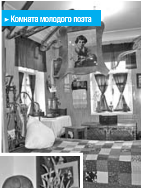
▶ Комната молодого поэта

С именем Сергея Есенина связаны разные уголки Москвы. Но есть в переулках Замоскворечья поистине уникальный дом, который стал первым адресом поэта в Москве. В этом доме, в квартире №6 долгие годы жил отец Сергея – Александр Никитич Есенин. Именно к отцу на постоянное место жительства приехал юный поэт из родных рязанских мест. Этот дом – единственный в Москве, где Есенин прожил дольше всего и где официально был прописан с 1912 по 1918 год. Сегодня здесь, в Большом Строченовском переулке, расположен Московский государственный музей Сергея Есенина.