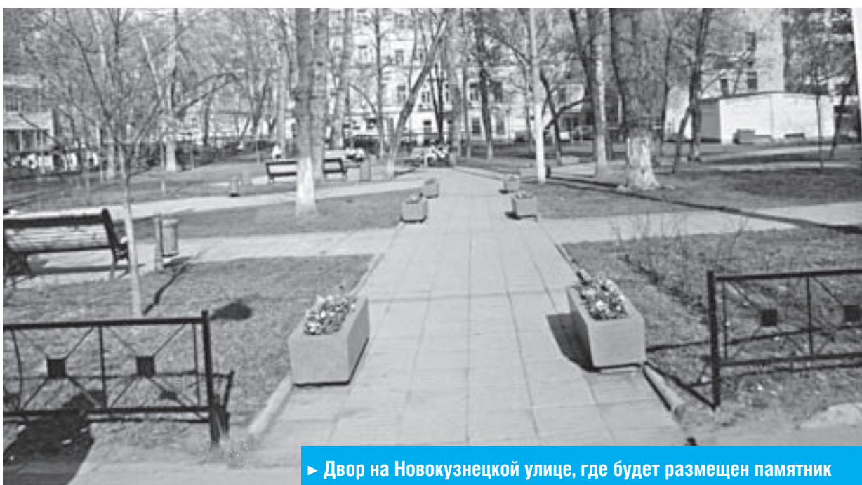
► Двор на Новокузнецкой улице, где будет размещен памятник

Сегодня уже утвержден проект памятного знака погибшим воинам 9-й и 17-й дивизий народного ополчения, основу которых составили жители района Замоскворечье. Памятник планируют разместить в сквере на Новокузнецкой улице, между домами 31 и 33, к 9 мая 2013 года. Автор проекта — известный скульптор Салават Щербаков.