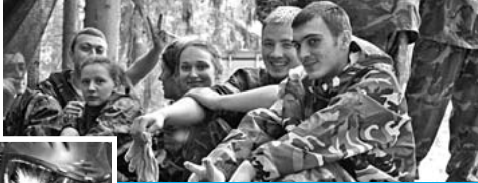
► Как и в подлинном сражении, в пейнтбольном Бородино русские взяли верх

В июле молодежь района Замоскворечье участвовала в необычном мероприятии – реконструкции Бородинского сражения... на пейнтбольной площадке! Да-да, совершенно серьезно.