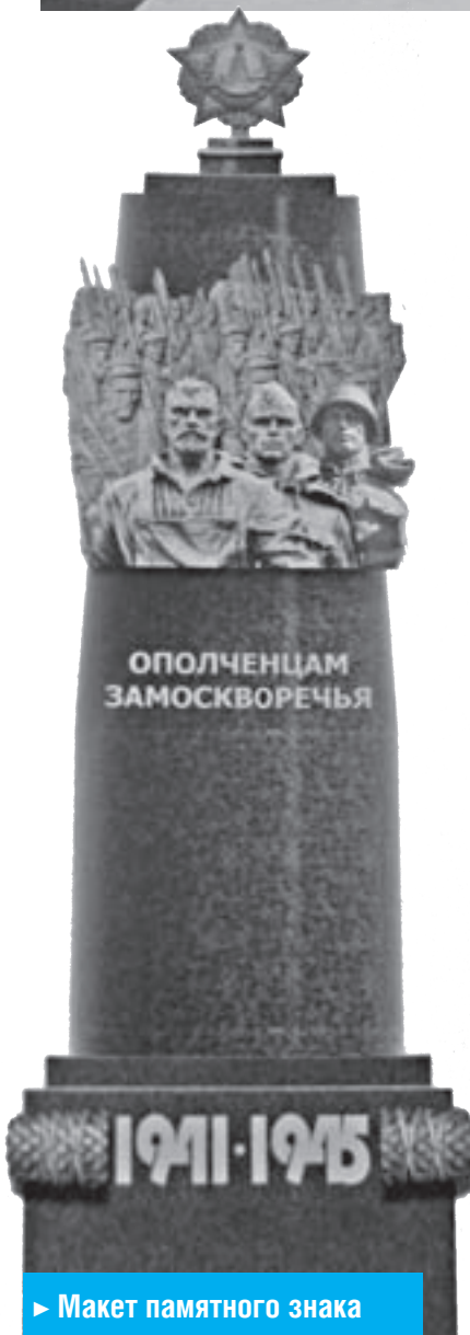
► Макет памятного знака

Обе дивизии 31 июля 1941 года вошли в состав 33-й армии резервного фронта и сосредоточились для обороны рубежей Москвы в районе Спас-Деменск — Ельня, где и приняли бой с наступающими танковыми частями фашистской армии. Почти 90%