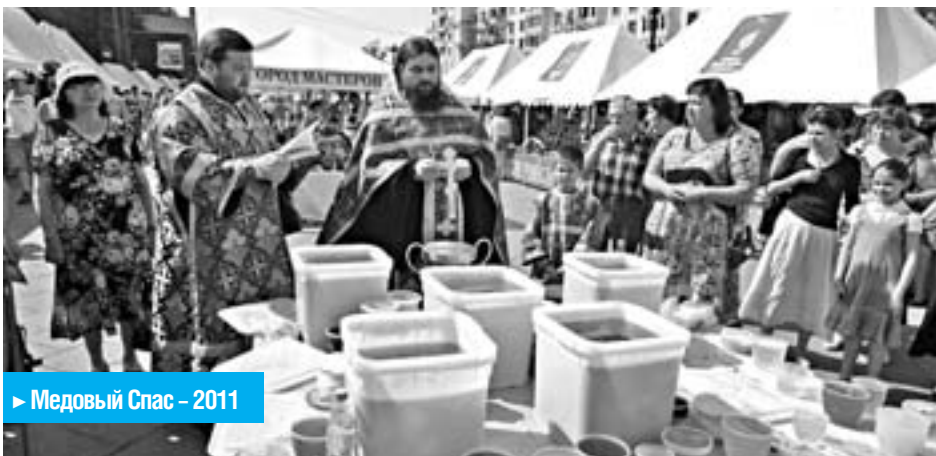
► Медовый Спас – 2011

«Что в августе соберешь, с тем и зиму проведешь», – гласит народная мудрость. Праздник Преображения Господня, известный в народе как Спас, повсюду считается праздником урожая и земных плодов. Но так как к этому дню далеко еще не все плоды поспевают, то крестьяне из одного праздника сделали три и повсеместно празднуют Первый Спас – 14 августа, Второй Спас – 19 августа и Третий Спас – 29 августа.