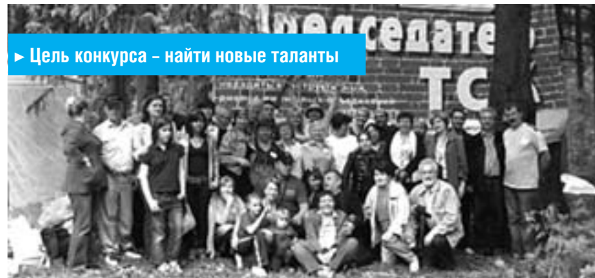
► Цель конкурса – найти новые таланты

Как отмечают организаторы конкурса, своей главной целью они видят необходимость раскатать народную творческую инициативу, призвать художников слова — поэтов, песенников, писателей и публицистов к созданию художественных произведений. Конкурс должен способствовать формированию добрососедских отношений, воспитанию самосознания собственника жилья у современных и у подрастающего