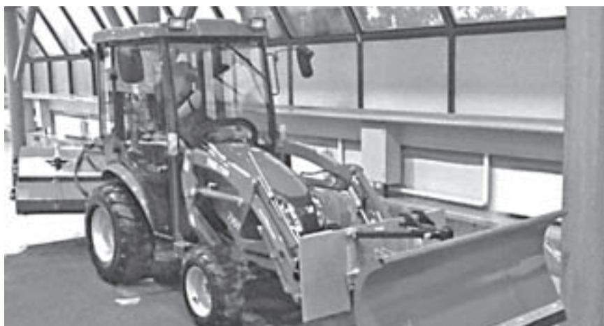
► Выставки форума позволят познакомиться с новинками техники

Место проведения – Всероссийский выставочный центр, павильон № 75, Зал Б.