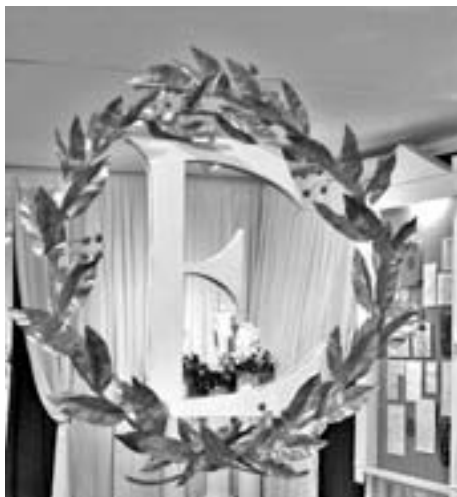
► «Цветные вечера» пройдут в уютных залах музея Есенина

Красный цвет в современной культуре также имеет несколько значений: страсть, социальные катаклизмы, кровь и жизнь. Поэтому программа вечера будет состоять из контрастных произведений — по мысли, настроению, тематике. Прозвучат стихи Сергея Есенина, Марины Цветаевой,