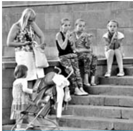
► Семьи с детьми могут получить в РУСЗН социальные льготы

Куда обратиться за положенными выплатами при рождении ребенка? Где получить региональные доплаты пенсионерам? На какие пособия могут рассчитывать различные социальные группы людей? Ответы на эти вопросы можно получить в Управлении социальной защиты населения района Замоскворечье (РУСЗН).