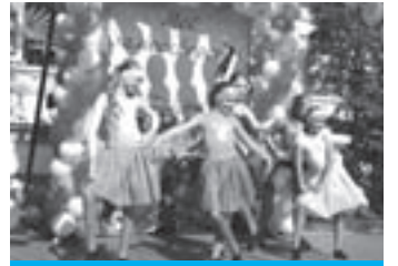
► День города – 2011 в Замоскворечье

В День города в столице запланировано более 600 различных мероприятий. Об этом сообщил министр Правительства Москвы, руководитель Департамента культуры Сергей Капков. Он уточнил, что все мероприятия можно условно разделить на центральные, в которых примут участие руководители государства и столицы, официальные делегации городов и регионов России; городские, подготовленные департаментами и комитетами Москвы; и мероприятия административных округов, организованные префектурами и управами столицы.