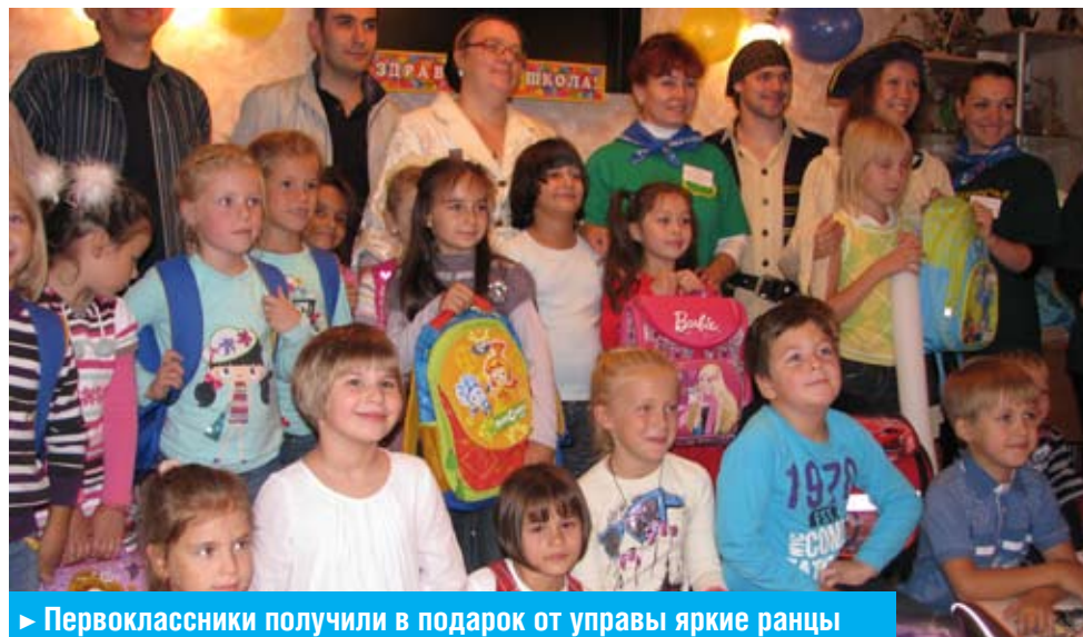
► Первоклассники получили в подарок от управы яркие ранцы