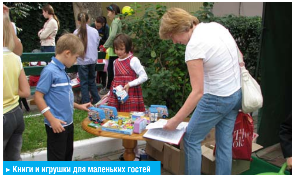
► Книжки и игрушки для маленьких гостей

— В этом году нас ждет двойной праздник, ведь День знаний совпадает с Днем города. То есть 1 сентября будет для наших школьников по-настоящему радостным и ярким событием, а для того чтобы и дальнейшая учеба оставалась для ребят праздником, управа района дарит первоклассникам замечательные ранцы.