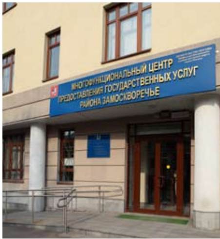
МФЦ «Замоскворечье» находится по адресу ул. Бахрушина, д. 13, тел.: (495) 666-30-80.

— За государственными услугами, предоставляемыми универсальными специалистами может обратиться любой житель нашего округа (ЦАО). А охотничий билет может получить любой гражданин, зарегистрированный в городе Москве. Для этого необходимо иметь при себе паспорт РФ, две фотографии 2,5*3,5 и заполнить заявление. В течение пяти рабочих дней он будет готов для выдачи заявителю.