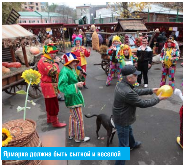
Ярмарка должна быть сытной и веселой

Вот и в Пятницком переулке всего на несколько дней развернулась сельскохозяйственная ярмарка. Торжественное открытие состоялось 12 октября. Клоуны и скоморохи встречали у стилизованных ворот гостей праздника, тут же вовлекали в хоровод, игры, конкурсы. Не могли усидеть на месте и сами торговцы. В этом году сельхозпроизводители приехали из Волгоградс-