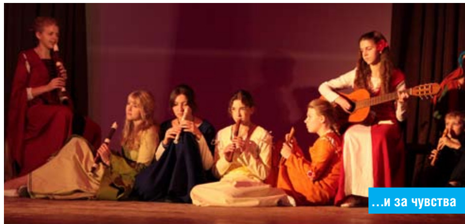
...и за чувства

– Зафиксирую внимание на двух моментах. Первое: наша школа всегда была устроена таким образом, что любой родитель мог спокойно в нее пройти. У нас отсутствуют турникеты, и я прекрасно осознаю минусы, но и считаю важным отметить несомненные плюсы. Мы всегда ожидали от родителей внимательного отношения к школе. Второе: в школе 400 с лишним учеников и у каждого родители, бабушки и дедушки. Многие из них крайне заинтересованы и хотят участвовать в школьной жизни, и странно этот ресурс не использовать. Я говорю классным руководителям: «Во всем классе всегда найдутся пять родителей, которые в разных областях гораздо профессиональнее вас. Обопритесь на них, и они сдвинут горы, помогут в самых разных вещах, начиная от фотоотчетов и заканчивая разработкой туристических маршрутов».