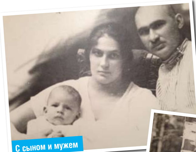
С сыном и мужем

В это же время мама познакомилась с моим отцом. В 1925 году они поженились, а годом позже родился я, первый ребенок. Вскоре отца назначили заместителем начальника финансового управления Приморского края, и мы по е-